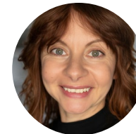
Nicole Freitag © Nicole Freitag [2025]