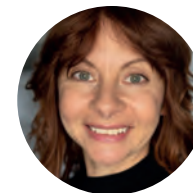
Nicole Freitag © Nicole Freitag [2025]