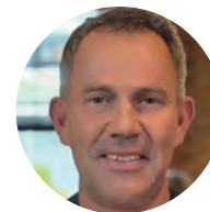
Prof. Dr. Nils Lahmann © Nils Lahmann [2025]