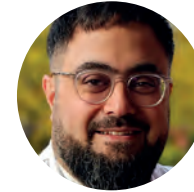
Dr. med. Volkan Aykaç © Johanna Müller